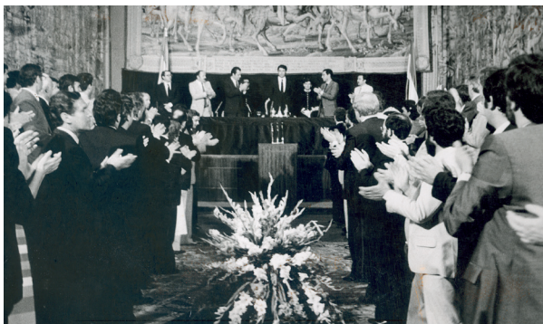
Constitución del Parlamento de Andalucía en los Reales Alcázares

El 23 de junio de 1979, el Pleno de la Junta aprobó que Andalucía se acogería a la vía del artículo 151 de la Constitución para la consecución de su autonomía.