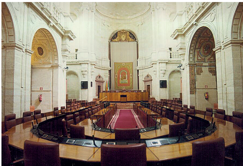
Salón de Plenos del Parlamento de Andalucía.

Estos mecanismos son los siguientes: las preguntas de iniciativa ciudadana, la comparecencia de agentes sociales afectados por la legislación; la iniciativa legislativa popular, y, según establece el artículo 78 de Estatuto de Autonomía, la convocatoria de encuestas, audiencias públicas, foros de participación y cualquier otro instrumento de consulta popular con la excepción del referéndum.