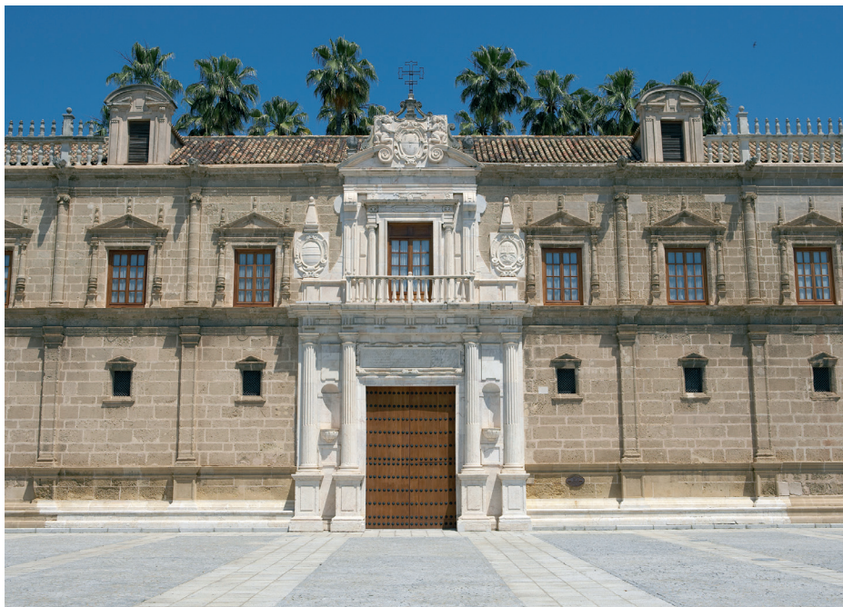
Fachada principal del antiguo Hospital de las Cinco Llagas.

Tras ocupar las sedes de los Reales Alcázares (junio 1982 - enero 1983), del Palacio de la Real Audiencia (febrero 1983 - noviembre 1985) y de San Hermenegildo (diciembre 1985 - febrero 1992), las gestiones realizadas para que el Parlamento de Andalucía contara con sede propia dieron sus frutos en febrero de 1992. El Pleno institucional del 28F, Día de Andalucía, se celebró ya en la nueva sede del Hospital de las Cinco Llagas.