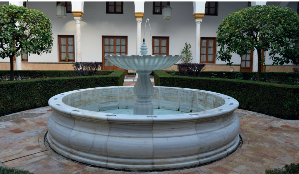
Interior del antiguo Hospital de las Cinco Llagas. Patio del Alcohol.

El Hospital mantuvo su actividad a lo largo de los siglos hasta que una plaga de termitas y un temblor de tierra a finales de los años sesenta del siglo XX aceleraron el abandono de las instalaciones, que se produjo en el año 1972, aunque aún se mantuvieron en el edificio algunos servicios secundarios.