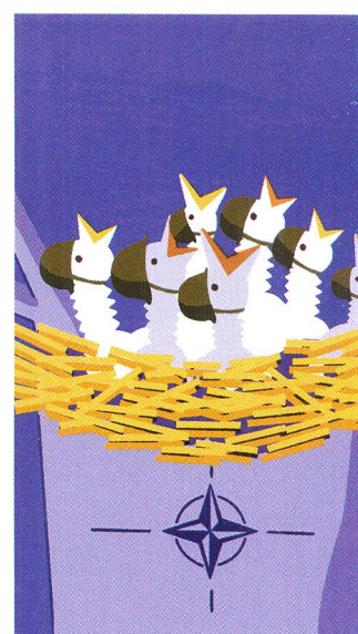
Una OTAN sin EE.UU. — p. 44