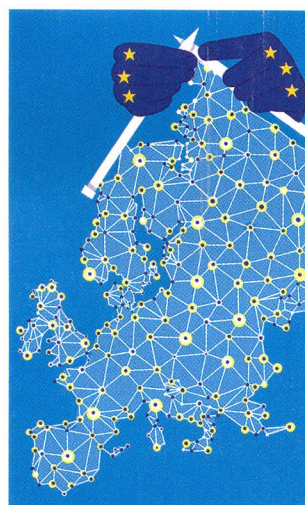
Poder digital europeo — p. 50