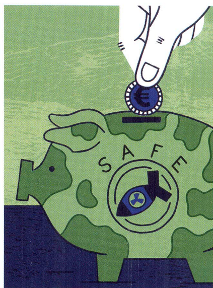
Más inversión en defensa — p. 27