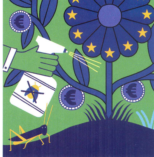
El proyecto europeo, obligado a crecer — pág. 6