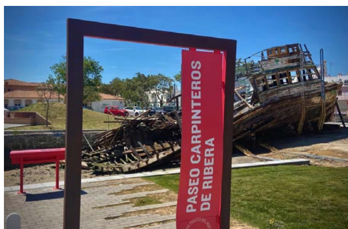
Situación actual de claro abandono del esqueleto del Adriano III